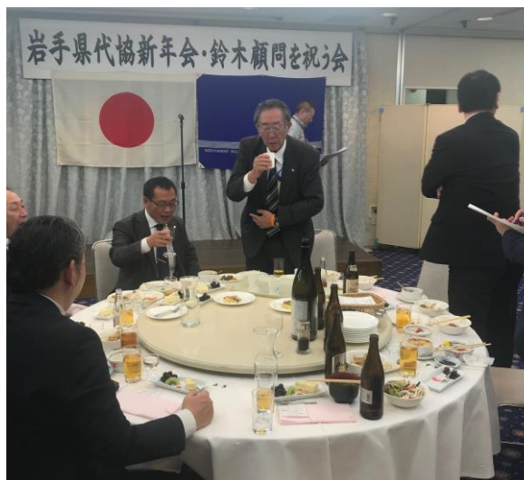
【ゲーム大会の様子】