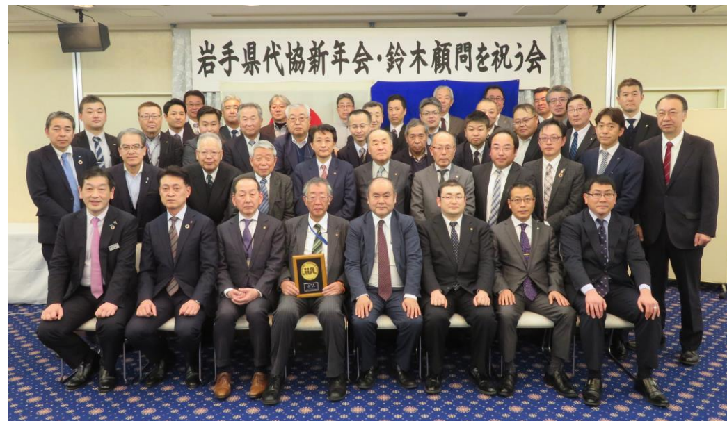
【開会前の集合写真】

これを機に、多数の会員の方々に各種行事等に参加していただけるよう役員も工夫を凝らしていきますので、今後ともよろしく願いいたします。