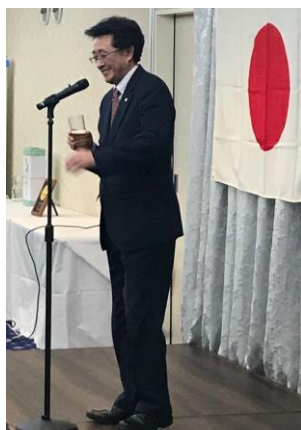
【乾杯の挨拶（館洞副会長）】