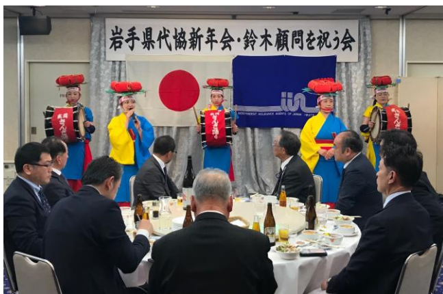
【「さんさ好み」の皆さん】